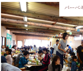
バーベキュー会場での昼食