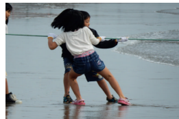
小さな子もガンバッテル！